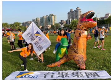
2023 台北科技盃 愛地球公益路跑