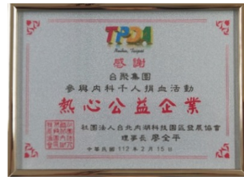
我愛捐血、內科最有愛