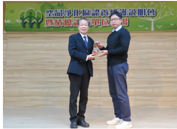
本公司持續認養空品淨化區 獲頒貢獻卓越獎座