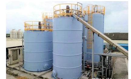
▲工研院與台聚合作防蝕隔熱塗料系統，可阻擋90%的大陽熱能進入儲槽，有效降低揮發性有機物逸散空氣中達20%以上，提供產業綠色創新材料解方。