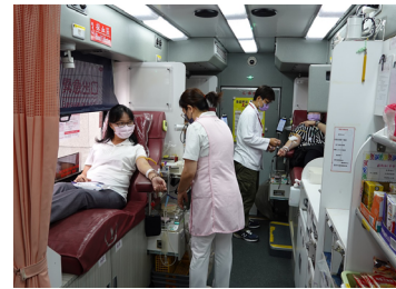
捐血傳愛 大家一起來