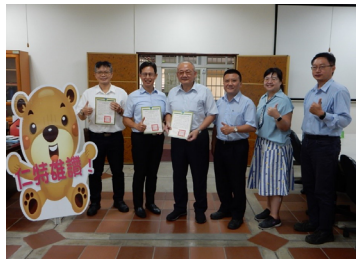
本公司第六年認養高雄市立仁武 特殊教育學校空品淨化區基地