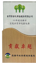
本公司獲高雄市政府環保局頒發 空品淨化區認養績優單位獎牌