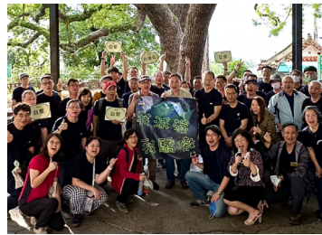
給地球一點顏色 台聚集團植下一片綠意