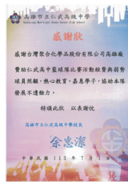
2023 年度台聚集團 公益籃球競賽