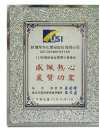
贊助仁武區後安里學童 學雜費補助計畫