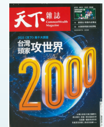
2023《天下》兩十大調查 台聚名列製造業 76 名