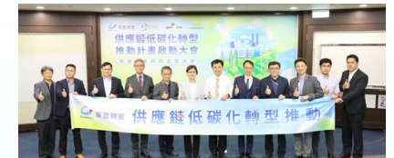
台聚簽署 「家登精密供應鏈低碳化轉型推動計畫」 合作備忘錄，目標 2025 共同減碳一萬噸